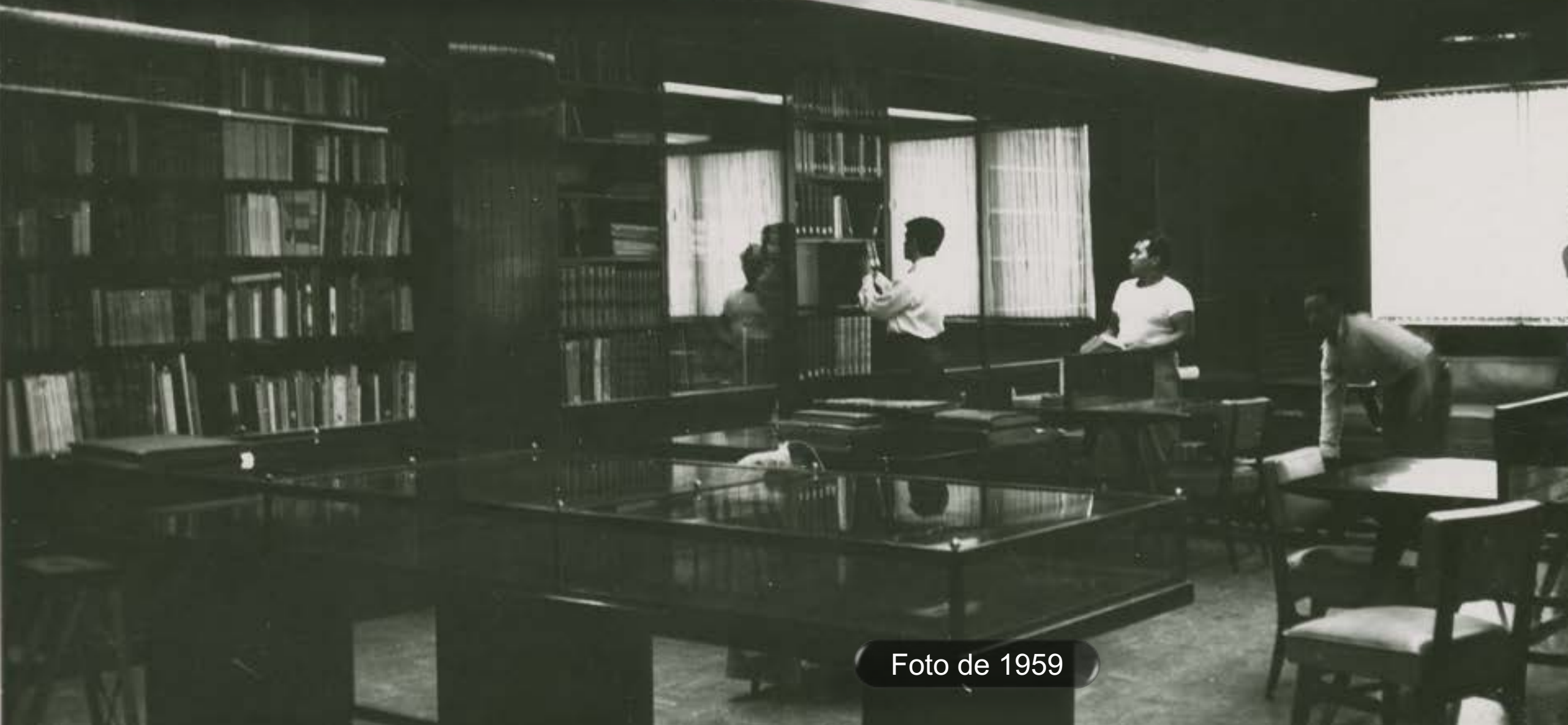
Foto de 1959

1954 | Se inaugura Biblioteca Cervantina