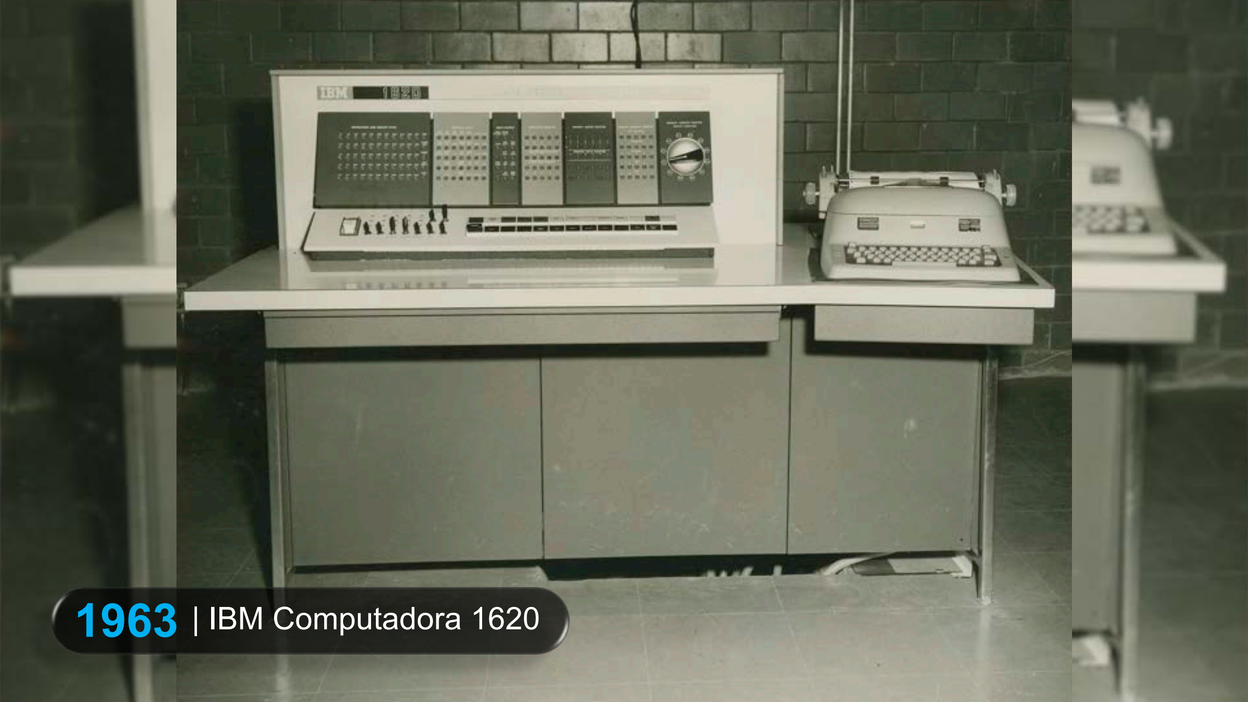
1963 | IBM Computadora 1620