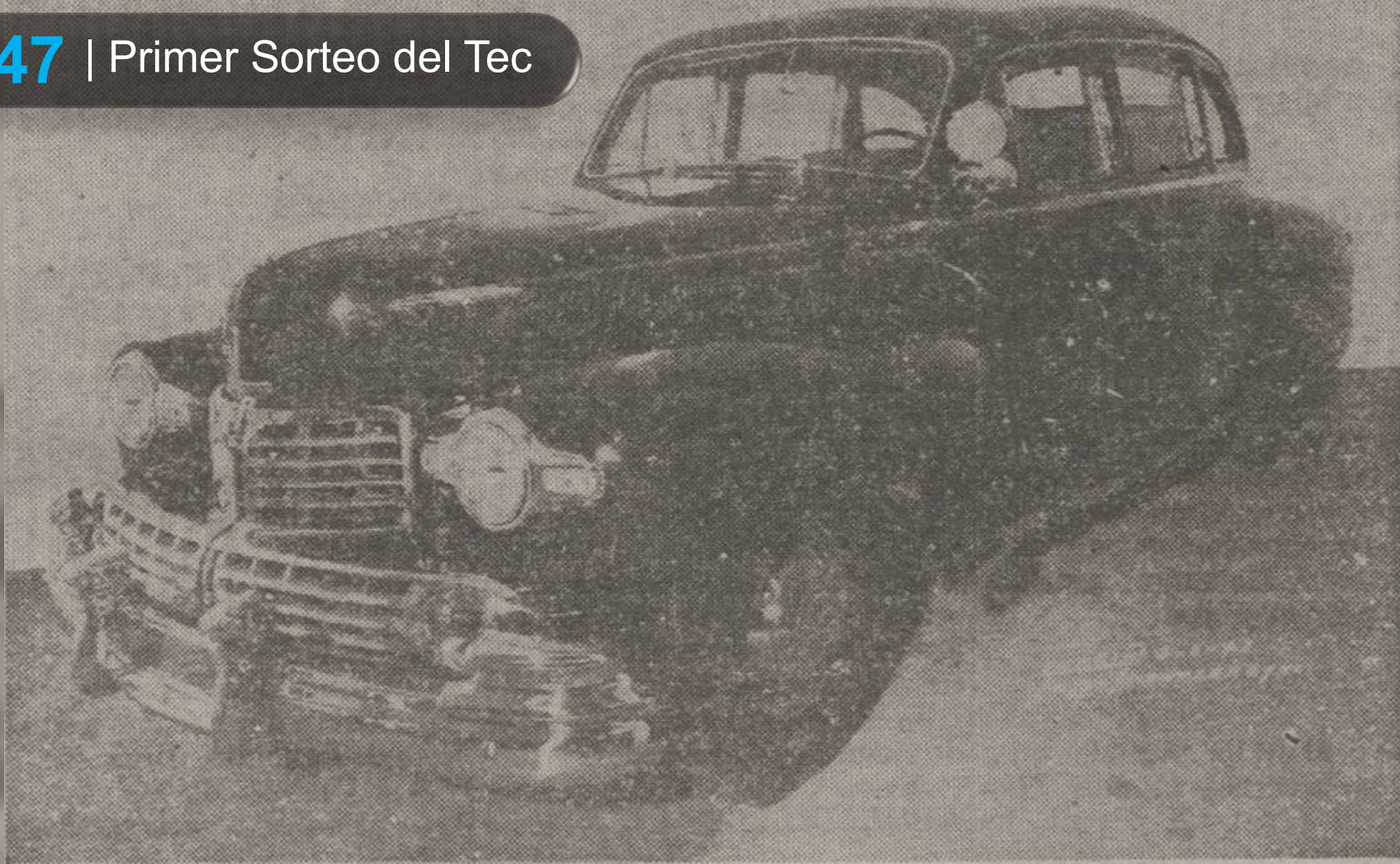
Un Lincoln Sedan 1947 Modelo de Lujo