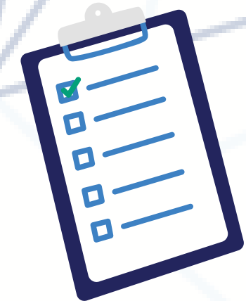
Resuelven un conflicto