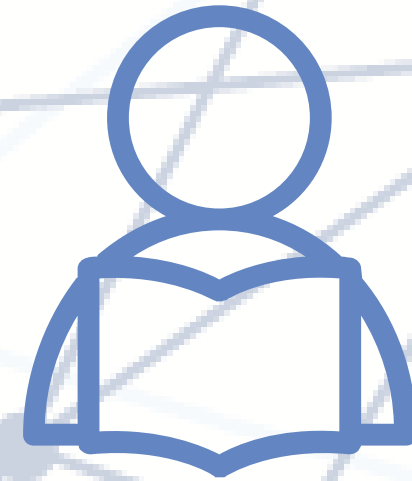
Alumnos y alumnas

La oportunidad para enfrentar a los alumnos y alumnas a problemáticas del mundo actual con base al modelo de las Naciones Unidas.