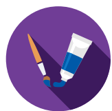
Gráfico o y visual

Especificaciones: foto o video con duración máxima de 3 minutos.